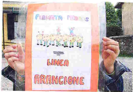
Tutti a scuola con il Pedbus. Anche a Ispra